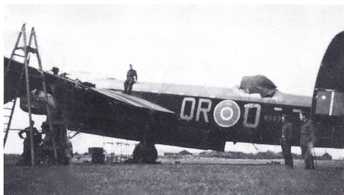
Dette fly Lancaster R5679 QR-O er her under reparation i august 1942. Under hjemturen fulgte flyet den planlagte rute næsten hen over "Rabe". Flyet styrtede ned ved Grønhøj nord for Karup den 25. september 1942. I 2013 blev en mindesten afsløret i Grønhøj!

På hjemmesiden AirmenDK er der omtalt en nedskydning af et allieret bombefly, som radarstationen RABE var en aktiv del af: »Atter en rolig nat for RAF med kun 51 bombefly i luften på mineringsopgaver ved Texel, Frisiske Øer, Helgoland og Østersøen, 27 Lancasters fra 5 BG fløj til Østersøen, og R5679 var det eneste tab over fjendtligt område. Den engelske radioaflytningstjeneste kunne senere oplyse, at flyet var blevet skudt ned af en tysk nat jager fra III/ NJG fra Grove. Den tyske radarstation "Rabe" ved Randers fik tildelt en andel af nedskydningen.» (Citat fra Flyvehistorisk Tidsskrift.) (FT 90-46-6) Radarstationen ledte jageren hen til bombeflyet over radioen.